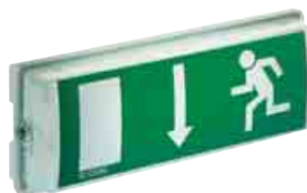
6011.1 CG-S mit Piktogrammfolie